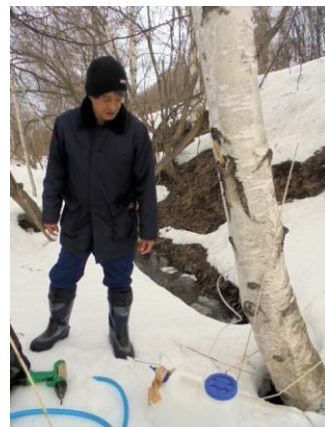
シラカンバの樹液採取