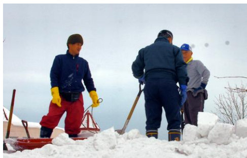
イグルーづくり 切り出し班