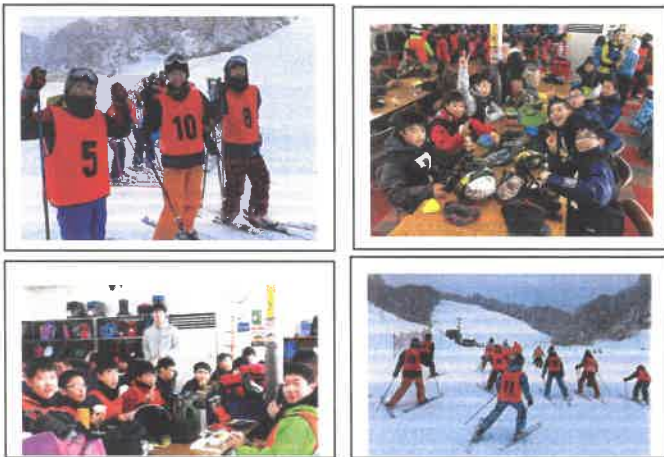
2年生スキー学習 1月23・30日