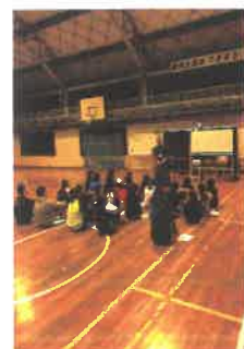
道北の学校から「小中一貫教育」視察にご来校されました。