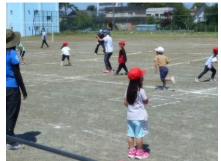
【1年生の指導の様子】