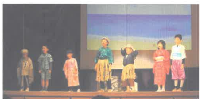
いなほ「うらしまたろう、じろう」