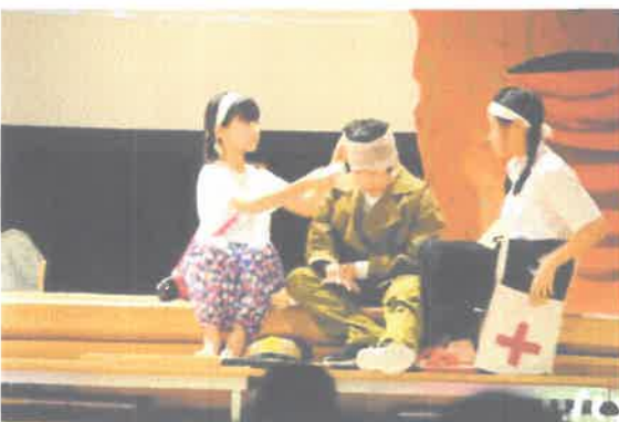
6年生「Shine～74年間語られること のなかった思い～」