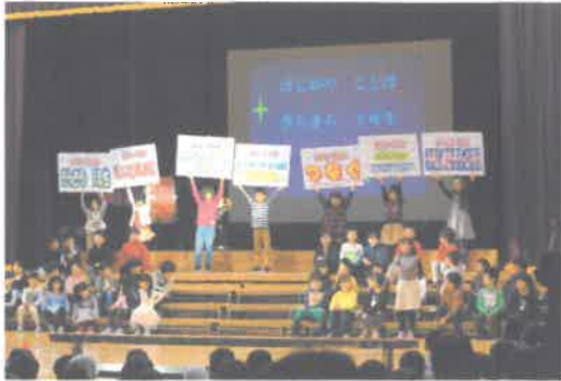
1年生「はじめの言葉」

11月16日(土)に、学習発表会を行いました。各学年とも練習の成果を発揮し、素晴らしい発表となりました。保護者の皆様、たくさんの温かいご声援と拍手、ありがとうございました。