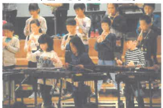
3年生「手と手をつなぐ3年生」