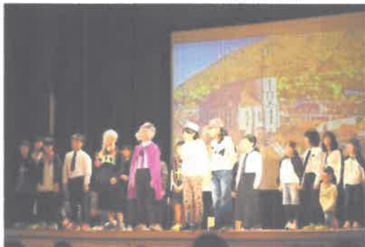
4年生「ドラキュラ伯爵と愉快的仲間たち」