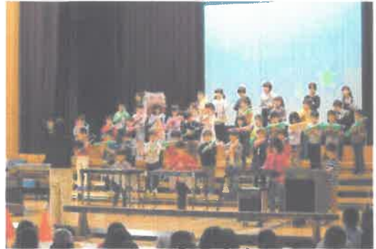
1年生「きらきら1年生」