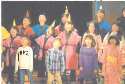
2年生「ないた赤おに」