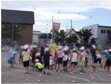
1・2年 玉入れポンポン