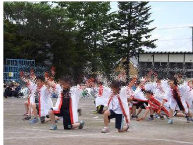
3・4年 西当ソーラン