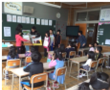
1年生に相芝居を見せている6年生

開校してから、65年目を迎えますが、確実に良いレジェンド（伝統）が引き継がれています。先生方と子どもたちが、「西当小のプライド」を大切に、もっと素敵な西当小を創っていきますので、保護者、地域の皆様方の大きなご支援・ご協力を引き続きお願い申し上げます。